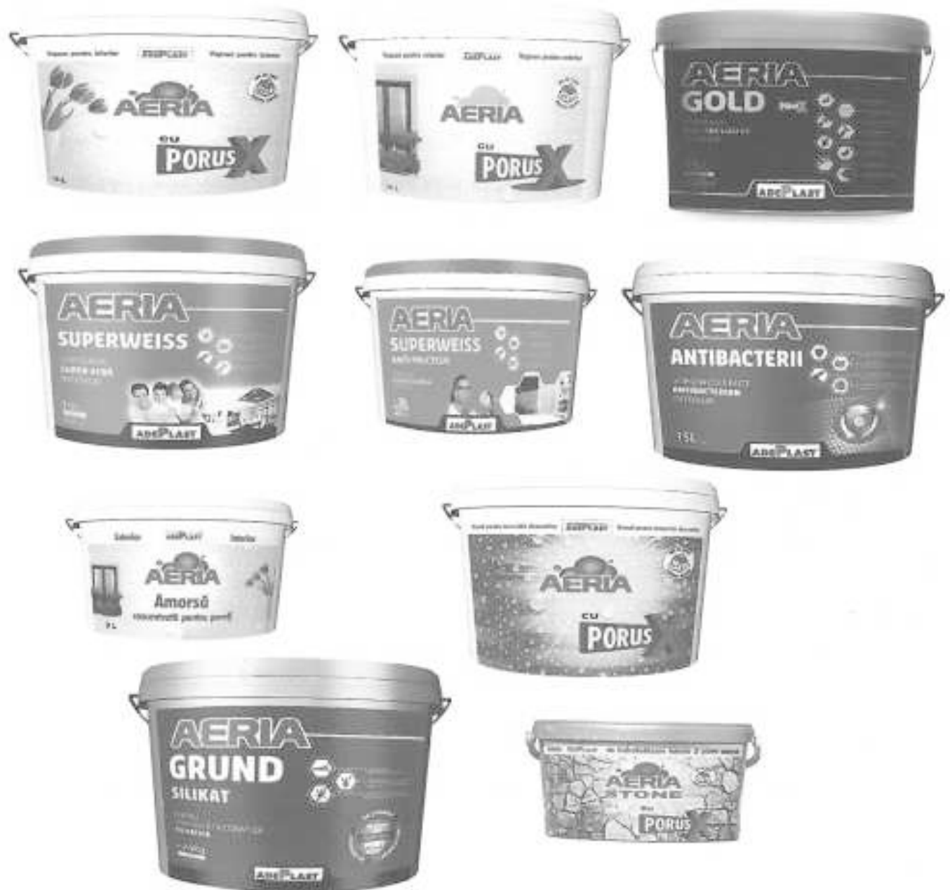
Produse pentru finisaje – AERIA CU PORUS X